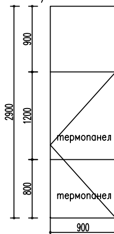
ВРАТА ВЪНШНА ТИП N10 28/A-20 – 16бр.